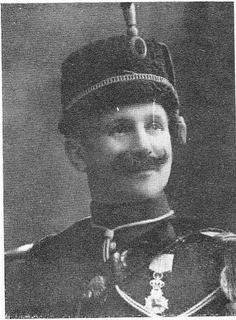
DUNGELHOEFF, Gustave, né le 9 octobre 1867, à Bruxelles.

Brillant officier et entraîneur d'hommes; mourut à l'hôpital militaire belge de Cabour (Adinkerque) le 21 décembre 1917.